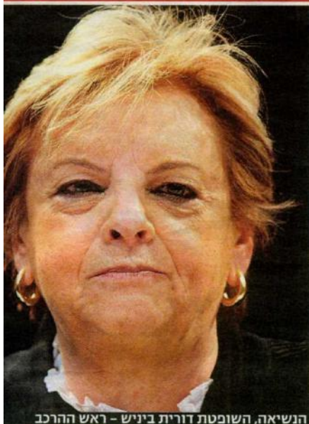
הנשיאה, השופטת דורית ביניש - ראש הרכב